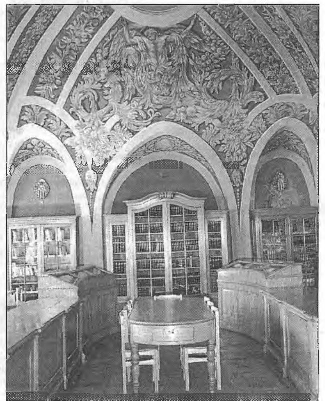
У бібліятэцы Вільнюскага універсітэта